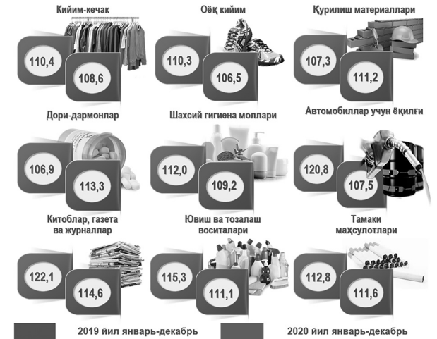
Республика бўйича ноозиқ-овқат маҳсулотларнинг йиллик ИНИ динамикаси, фоизда

бий хизматларга талабнинг ошиши таъсирида тиббий лаборатория хизматлари 14,8 фоизга, тиббий амбулатор ва реабилитация хизматлари 10,9 фоизга, тиббий диагностика хизматлари 8,1 фоизга ҳамда стационар