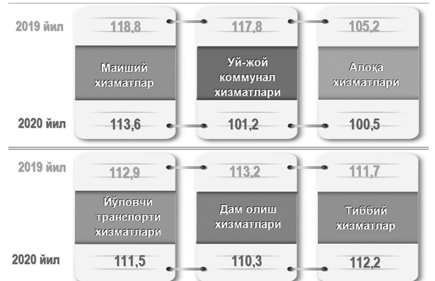
Республика бўйича аҳоли учун пуллик хизматлар алоҳида гуруҳларининг йиллик ИНИ, фоизда

келгусида ҳам ички бозордаги истеъмол нархлари кузатувларини сифатли ташкил этиш ҳамда тегишли статистик маълумотларни кенг жамоатчиликка етказиш бўйича ишлар давом эттирилади.