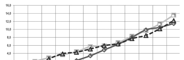
Республика бўйича 2020 йилда айрим турдаги хизматлар нархларининг ўзгариши, фоизда

2020 йил якуни бўйича мамлакатимизда инфляция даражасининг сезиларли даражада пасайиши кузатилди. Ўз навбатида, Давлат статистика қўмитаси томонидан