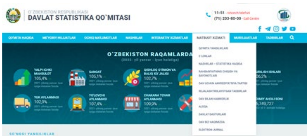
5-rasm.Matbuot xizmati bo'limi

Ushbu bo'limda Statistika doir yangilik, e'lonlar, hamkorlik, reja qilingan tadbirlar to'g'risida ma'lumotlarni ko'rishingiz mumkin