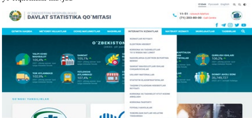
4-rasm.Interaktiv xizmatlar bo'limi

Ushbu bo'limda Statistik hisobotlar topshiradigan tadbirkorlik subyektlariga ma'lumot va yo'riqnomalar mavjud