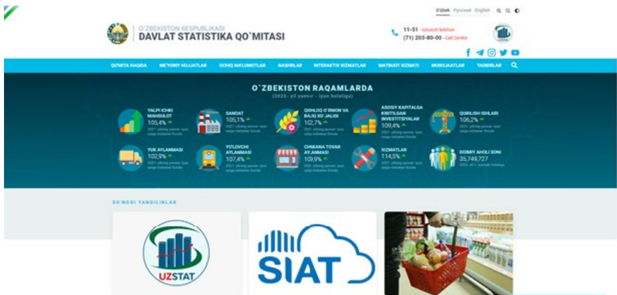
1-rasm. Asosiy sahifa

Asosiy sahifaga kirgandan so'ng foydalanuvchi saytdagi mavjud bo'limlardan o'zini qiziqtirgan barcha ma'lumotlarga kirishi, o'zini qiziqtirgan savollarga javob olishi mumkin.