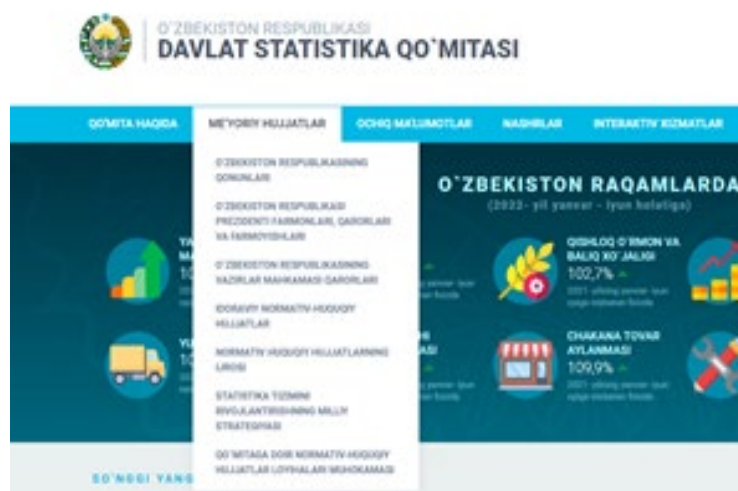
2-rasm. Me'yoriy hujjatlar bo'limi

Ushbu bo'limda O'zbekiston Respublikasining statistikaga oid bo'lgan farmon, qaror va normativ huquqiy hujjatlaridan namunalar mavjud.