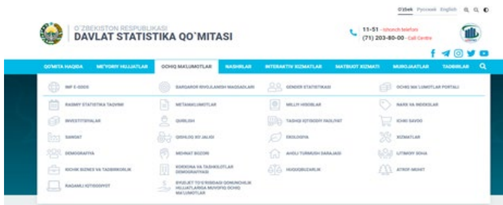
3-rasm. Ochiq ma'lumotlar oynasi