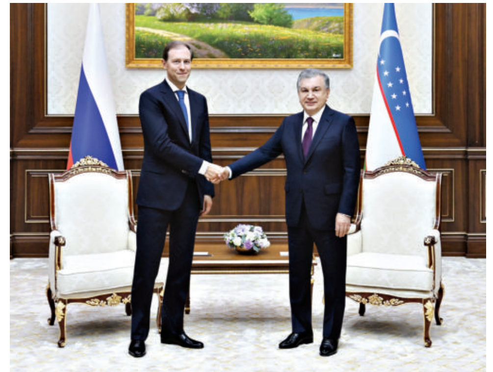
Ўзбекистон Республикаси Президенти Шавкат Мирзиёев 5 апрель кунни халқаро "Иннопром" саноат кўргазмасида иштирок этиш учун Тошкент шаҳрида бўлиб турган Россия Федерацияси саноат ва савдо вазири Денис Мантуров бошчилигидаги делегацияни қабул қилди.

Таъкидлаш жоизки, "Иннопром" Россия Федерацияси Хукумати томонидан иқтисодиётнинг турли тармоқларида илғор технологиялар ва замонавий ишланмаларни биргаликда илгари суриш мақсадида ўтказиб келинаётган энг йирик кўргазма ҳисобланади. Ушбу тадбир мамлакатимизда биринчи марта ўтказилмоқда.