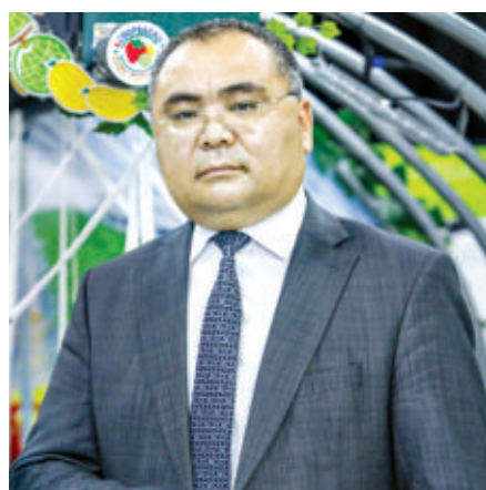
Иброҳим АБДУРАҲМОНОВ, инновацион ривожланиш вазири, академик

Коронавирус пандемиясининг илк кунлариданоқ давлатимиз раҳбари томонидан ўз вақтида амалга оширилган чора-тадбирлар туфайли COVID-19 пандемиясининг оммавий таъсири бошқа ўлкалардагига қараганда анча оз бўлди. Инсоният аввал дуч келмаган ушбу офатга қарши мамлакатимизнинг барча тегишли тизимлари сафарбар этилгани, аҳоли саломатлигини муҳофаза қилиш ва инфекция тарқалишининг олдини олиш тадбирларининг ўзаро узвийлик, тезкорлик билан жорий қилингани бунинг асосий омилларидан бири бўлди, албатта.