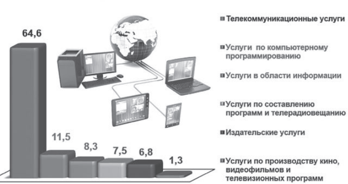
Структура услуг связи и информатизации по городу Ташкенту за 2020 год*

Вместе с тем в столице республики зафиксирован наибольший удельный вес услуг связи и информатизации - 9,1 процента. Это обусловлено тем, что Ташкент - город с довольно развитой информационно-коммуникационной инфраструктурой. При сопоставлении с другими регионами здесь отмечены наибольшие показатели услуг по компьютерному программированию, консультационным и другим сопутствующим услугам (11,5 процента), в области информации (8,3), по составлению программ и телерадиовещанию (7,5), издательским услугам (6,8), производству кино, видеофильмов и телевизионных программ, звукозаписи и изданию музыкальных произведений (1,3). Телекоммуникационные услуги в структуре услуг связи и информатизации заняли относительно невысокий удельный вес, составив 64,6 процента.