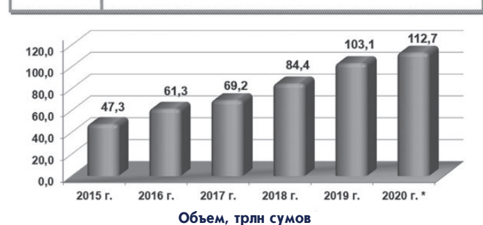
Динамика объема услуг, оказанных субъектами малого предпринимательства

За прошедшие десятилетия XXI века роль сектора малого предпринимательства в значительной степени повысилась из-за