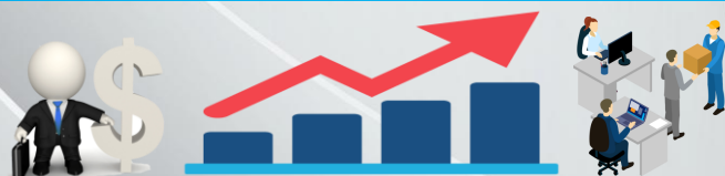
6. КОЛИЧЕСТВО ПРЕДПРИЯТИЙ И ОРГАНИЗАЦИЙ (на 1 июня, единиц)