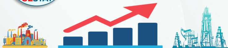
1. ИНДЕКС ФИЗИЧЕСКОГО ОБЪЕМА ПРОМЫШЛЕННОГО ПРОИЗВОДСТВА, %