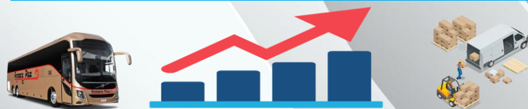
5. ТЕМПЫ РОСТА ОБЪЕМА ОКАЗАННЫХ УСЛУГ, %