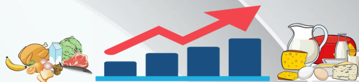
2. ИНДЕКС ПОТРЕБИТЕЛЬСКИХ ЦЕН (май к предыдущему месяцу, %)