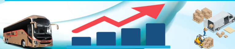
5. ТЕМПЫ РОСТА ОБЪЕМА ОКАЗАННЫХ РЫНОЧНЫХ УСЛУГ, %