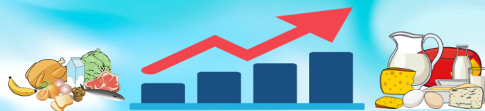
2. ИНДЕКС ПОТРЕБИТЕЛЬСКИХ ЦЕН (май к предыдущему месяцу, %)