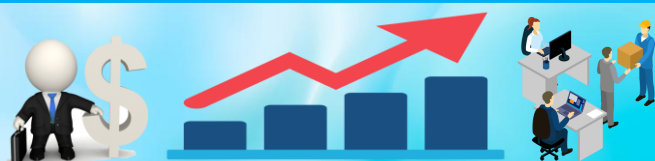
6. КОЛИЧЕСТВО ПРЕДПРИЯТИЙ И ОРГАНИЗАЦИЙ (на 1 июня, единиц)