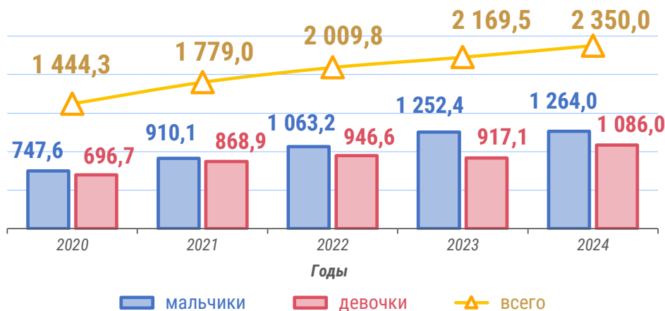
Численность детей в дошкольных образовательных организациях (на конец соответствующего года, тыс. человек)

За 2024 год численность девочек в дошкольных образовательных организациях возросла на 168,9 тыс. , т.е. на 18,4 % , а мальчиков — на 11,6 тыс. , т.е. на 0,9 % .