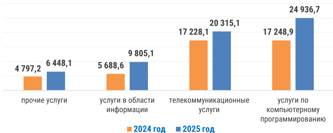
Объём услуг связи и информатизации по видам за январь–октябрь 2025 года, в млрд сум

За январь–октябрь 2025 года объём услуг в сфере образования был равен 30 419,9 млрд сум, в их составе преобладали услуги высшего образования – 46,6 %.