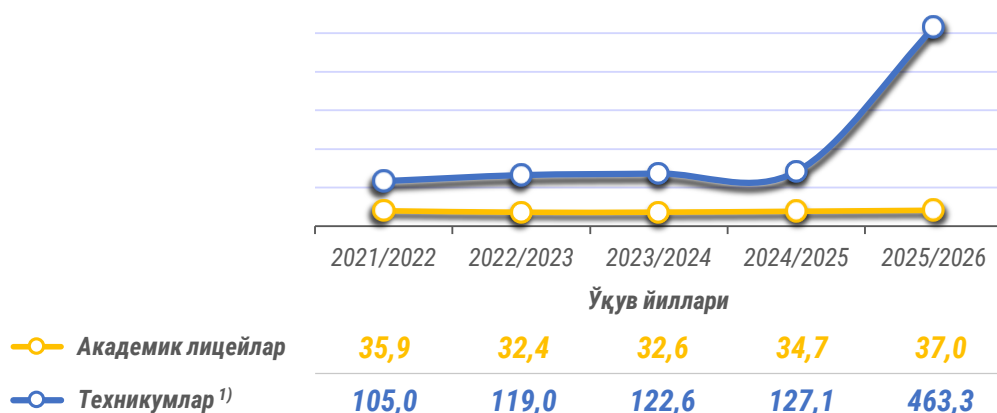
Таҳсил олаётган ўқувчилар сони (тегишли ўқув йили бошига, минг киши)

Ўзбекистон Республикасида сўнги йилларда ўрта махсус ва профессионал таълим ташкилотларида таҳсил олаётган ўқувчилар умумий сонининг ўсиши кузатишган. 2025/2026 ўқув йили бошига уларнинг сони 2024/2025 ўқув йилига нисбатан 71,8 минг нафарга , яъни 16,8 % га ошган ва 500,3 минг нафарни ташкил этган.