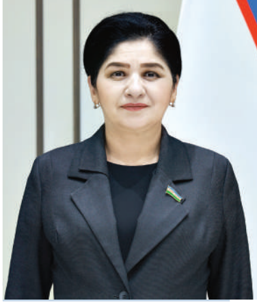
Малика ҚОДИРХОНОВА, Олий Мажлис Сенати аъзоси

Марказий Осие, хусусан, Ўзбекистон ҳам бундан мустасно эмас. Сўнгги 10 йилда мамлакатимиз иқтисодий кенг қўламли ўзгаришларни бошдан кечириб, ёпиқ қатъий тартибга солинадиган тизимдан минтақанинг энг жадал ривожланаётган иқтисодиётларидан бирига айланди. Иқтисодиёт кўлами амалда икки баравар ошди, яъни ички маҳсулот ҳажми 2017 йилдаги тахминан 56 миллиард доллардан 2025 йилга келиб, рекорд даражада — 145 миллиард долларга етди. 2025 йилда реал ЯИМ 7,7 фоиз ўсди. Бу сўнгги ўн йилликлардаги энг юқори кўрсаткич бўлди. Инфляция даражаси икки хонали рақамлардан (2018 йилда 17,5 фоиз) 2026 йил бошига келиб, 7,3 фоизгача пасайди.