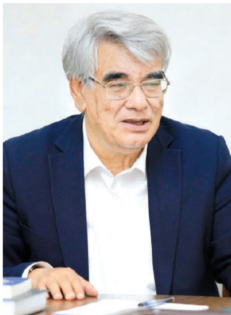
Усмон АЗИМ, Ўзбекистон халқ шоири

Ҳақиқий ёзувчи-шоирлар ҳақиқатни ёзишни хуш кўради. Дунёнинг қайси бир четдаги адолатсизлик уларга худди ўзининг уйда рўй бераётгандек туюлади. Қайдадир адолатнинг барқарорлиги ёки ғалабаси уларнинг руҳиятини кўтаради. Улар ҳар бир яхши одамнинг муваффақиятидан қувонади, одамларнинг муаммолари эса уларнинг ҳам дардига айланади.