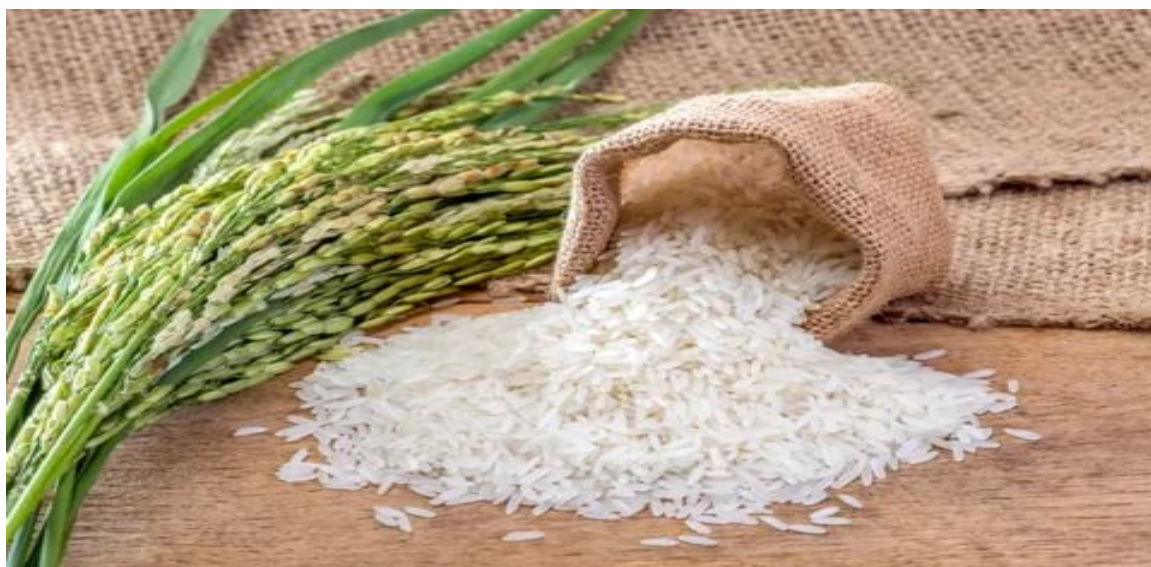
Рис от 4000 до 18000 сумов за кг.

Минимальная цена за десяток яиц в размере (5 500) сумов зарегистрирована на рынках “Миробод деҳқон бозори” г.Ташкент. Самая высокая цена (10000 сумов) также отмечена в г.Карши - “Қарши деҳқон озиқ-овқат бозори”, г. Самарканд - “Сиёб деҳқон бозори”, “Темирийўл деҳқон бозори” и “Дамарик деҳқон бозори”, г.Чирчик - “Чирчиқ шаҳри деҳқон бозори”,г. Ургенч - “Урганч марказий деҳқон бозори”, г. Ташкент “Миробод деҳқон бозори”, “Қўйлик деҳқон бозори”, “Фарход деҳқон бозори”, “Олой деҳқон бозори” и “Эски жўва деҳқон бозори”.