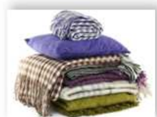
Бытовой текстиль – 2,3%