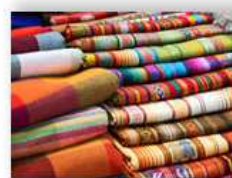
Ткани и пряжа – 1,2%