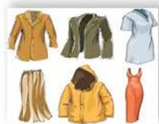
Одежда – 3,1%

Порядка 75,0 % от общего роста цен на непродовольственные товары обеспечило удорожание следующих их видов: