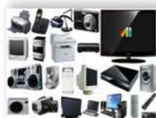
Культтовары – 1,7%