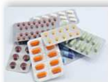
Медикаменты – 1,7%