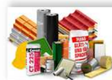
Стройматериалы – 1,8%