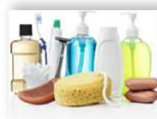
Товары личной гигиены – 2,6%

Влияние на прирост сводного ИПЦ – 0,5 п.п.