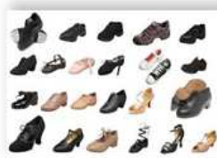
Обувь – 2,2%