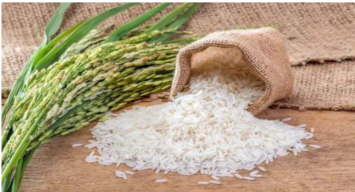
Рис от 4 000 до 18 000 сумов за кг.

Самая низкая цена риса на уровне (4 000) сумов за кг. наблюдалась на рынках “Нукус деҳқон бозори” г.Нукус и “Бухоро марказий деҳқон бозори” г. Бухара. Максимальная цена составила (18 000) сумов за кг. и была зарегистрирована в г. Ташкент – на “Олой деҳқон бозори” и “Миробод деҳқон бозори”.