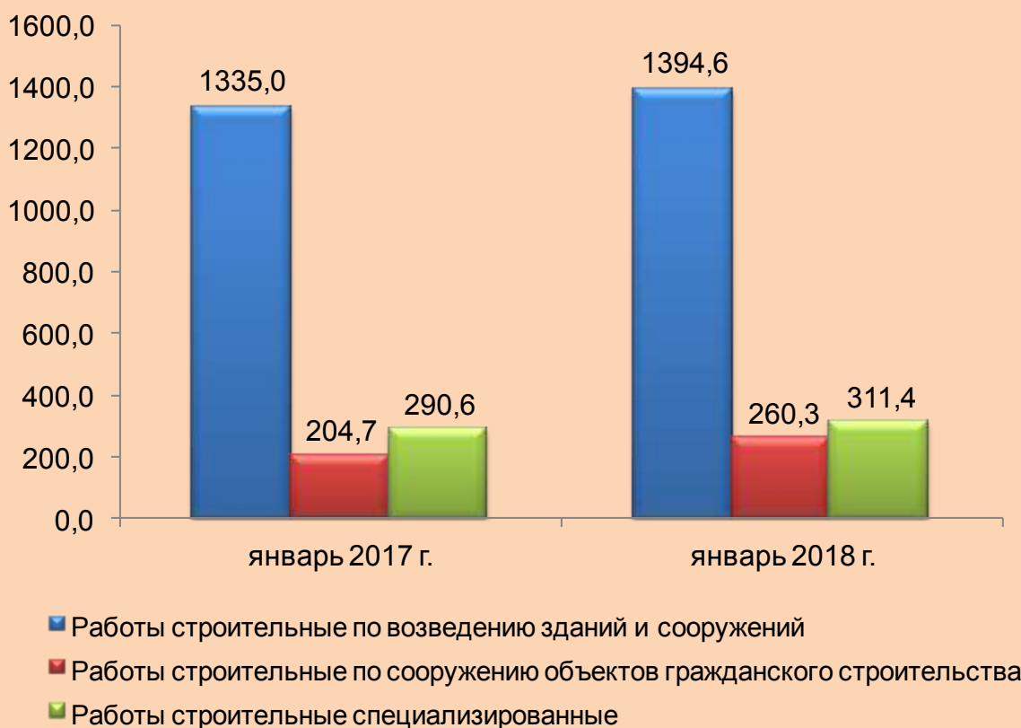
Строительные работы по видам экономической деятельности (млрд.сум)

Основная часть строительных работ по видам экономической деятельности была произведена за счет строительных работ, строительства жилых и жилых зданий и строительства нежилых помещений. Объем строительства гражданских объектов и специализированных строительных работ увеличился по сравнению с предыдущим годом.