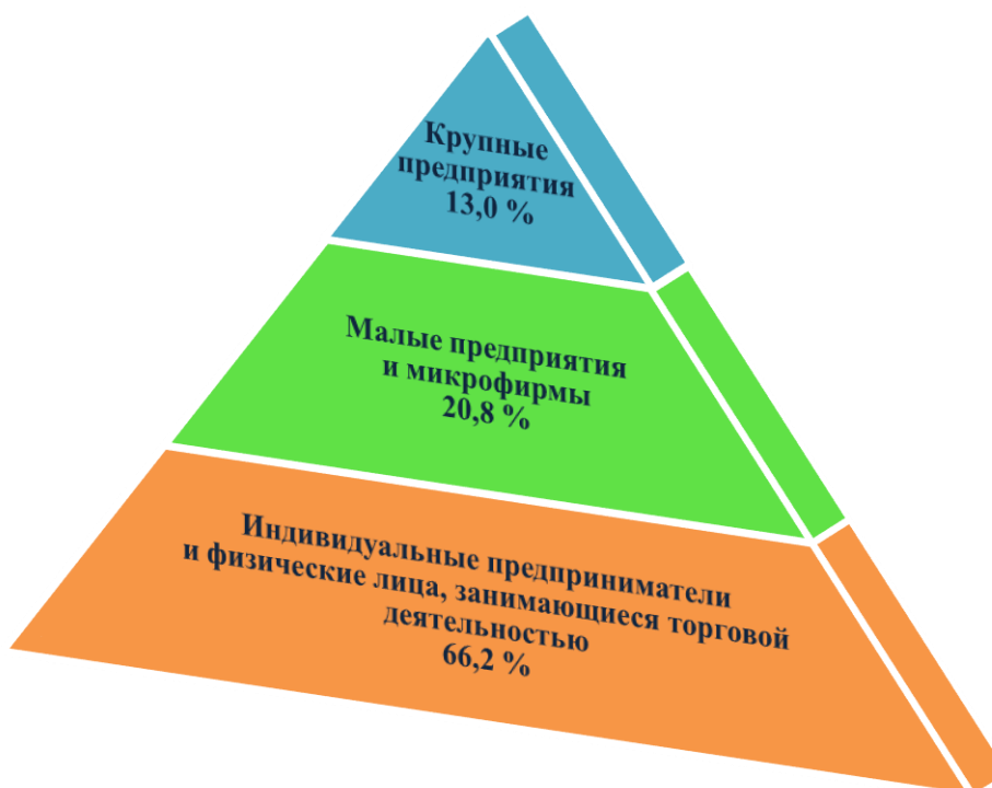
Структура розничной торговли (за январь-сентябрь 2018 года)

Структура розничного товарооборота по государственному и негосударственному секторам за январь-сентябрь 2018 года характеризуется следующими данными.