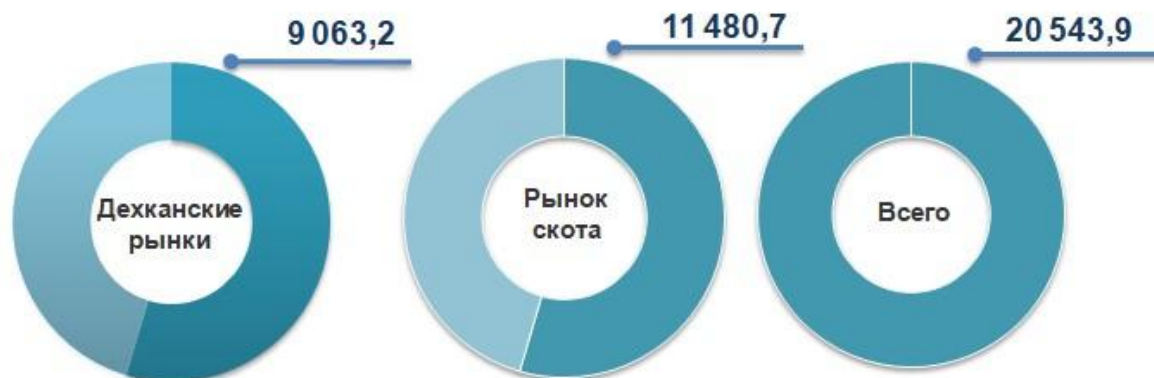
Неорганизованная торговля, млрд. сум