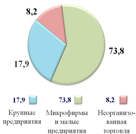
Структура товарооборота розничной торговли, в %